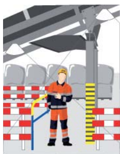
Rys. 4 Przejście pod przenośnikiem taśmowym