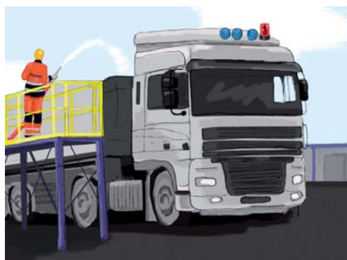
Rys. 3 Rampa do plandekowania pojazdów