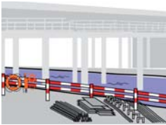
Rys. 3 Praca nad wodą