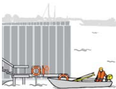
Rys. 2 Łódź ratunkowa