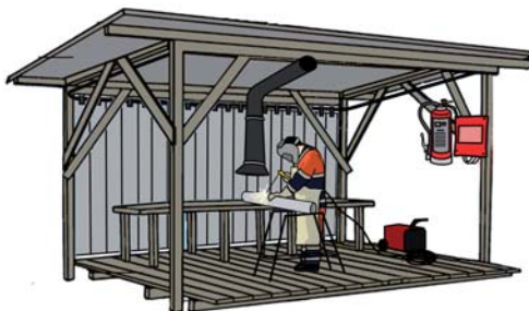
Rys. 1 Stanowisko spawalnicze na otwartej przestrzeni