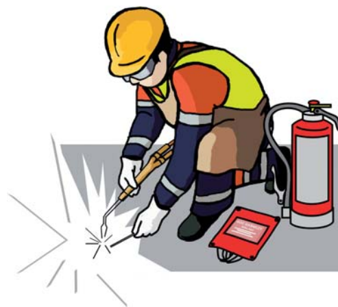
Rys. 2 Ruchome stanowisko spawalnicze