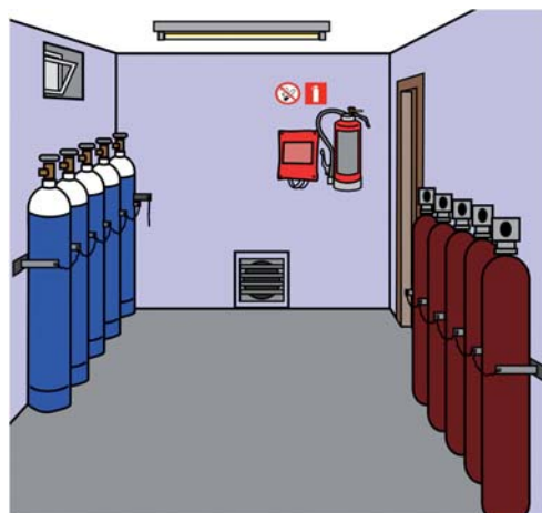
Rys. 3 Magazyn gazów technicznych