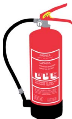
Rys. 2 Gaśnica proszkowa do gaszenia pożarów typu A, B i C