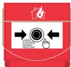
Rys. 3 Ręczny ostrzegacz pożarowy (ROP)